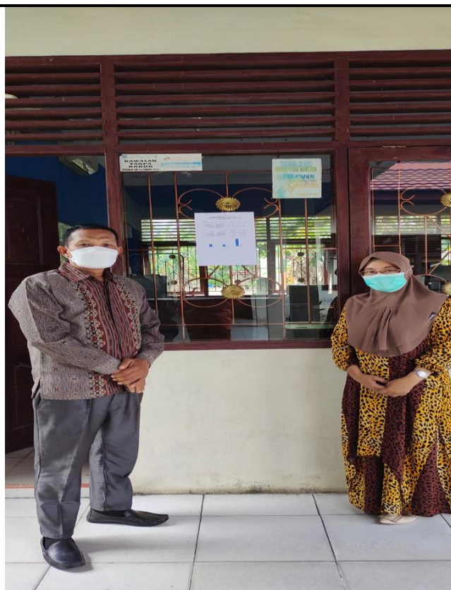
KECAMATAN PAGARAN TAPAH