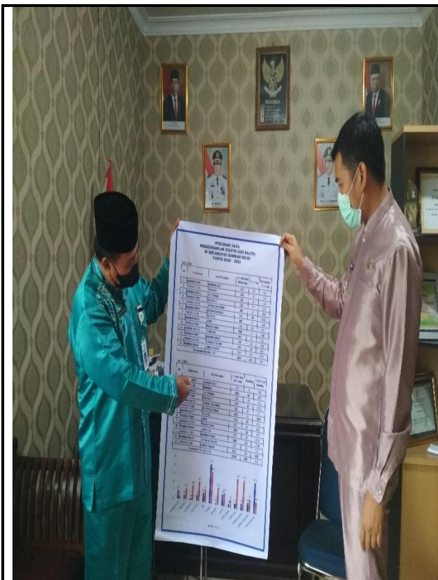
KECAMATAN RAMBAH HILIR