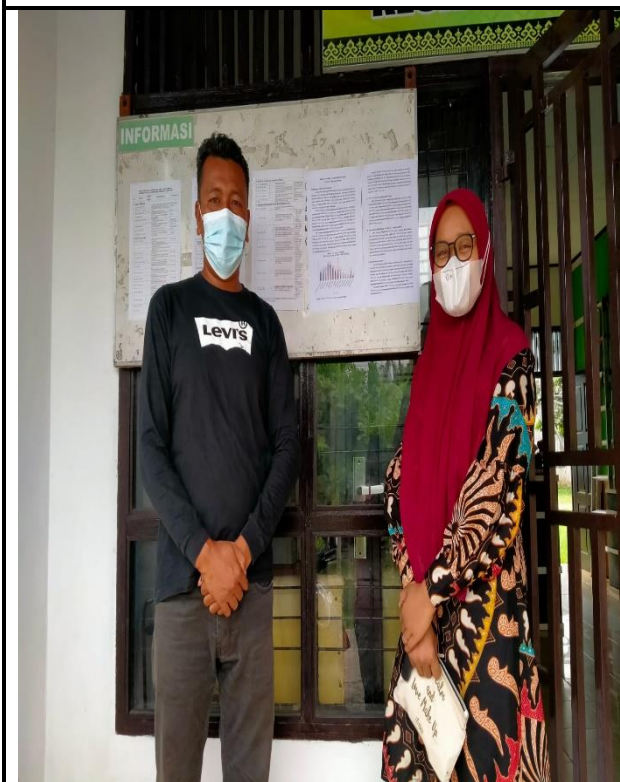
KECAMATAN RAMBAH SAMO